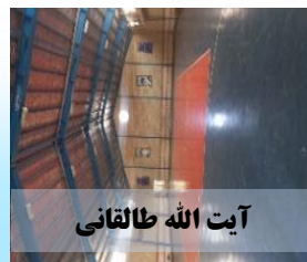
آیت الله طالقانی