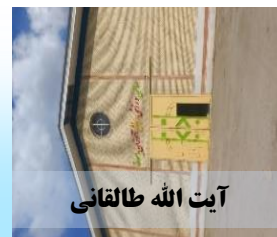
آیت الله طالقانی