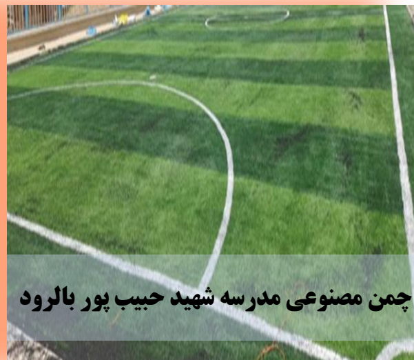
چمن مصنوعی مدرسه شهید حبیب پور بالرود