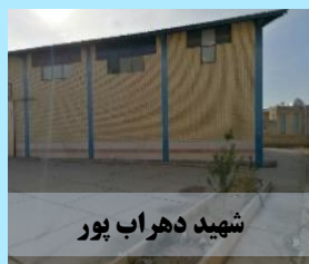
شهید دهراب پور