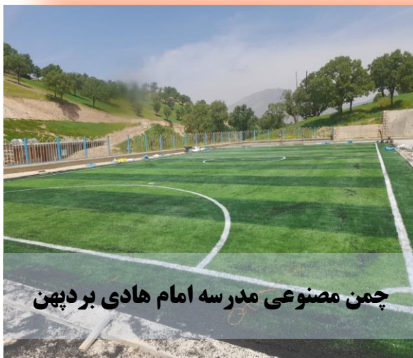
چمن مصنوعی مدرسه امام هادی بردپهن