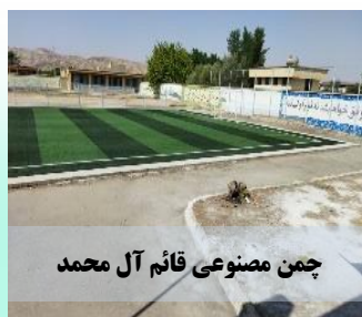
چمن مصنوعی قائم آل محمد