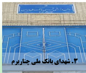
۳. شهدای بانگ ملی چناربرم