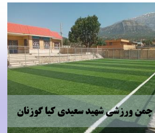
چمن ورزشی شهید سعیدی کیا کوزنان