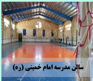
سالن مدرسه امام خمینی (ره)