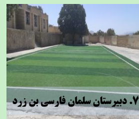
۷. دبیرستان سلمان فارسی بن زرد