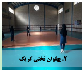
۲. پهلوان تختی کرکک