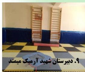
۹. دبیرستان شهید آرمیک میمند