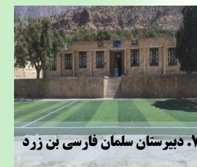
۷. دبیرستان سلمان فارسی بن زرد