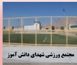
مجمع ورزشی شهدای دانش آموز