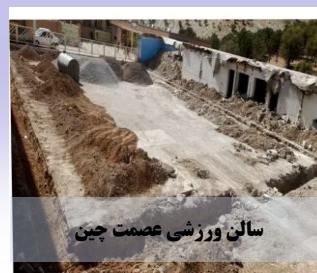
سالن ورزشی عصمت چین