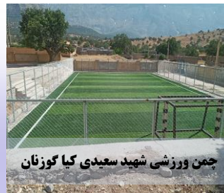
چمن ورزشی شهید سعیدی کیا کوزنان