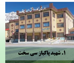
۱. شهید پاکباز سی سخت