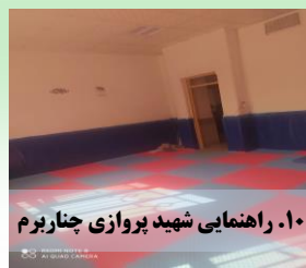
۱۰. راهنمایی شهید پروازی چناربرم