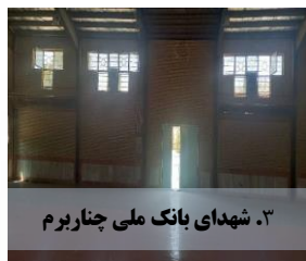
۳. شهدای بانگ ملی چناربرم