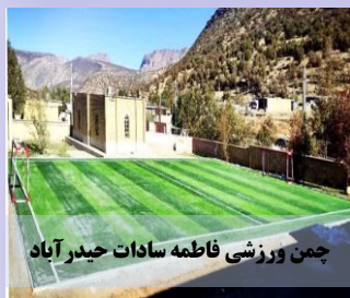
چمن ورزشی فاطمه سادات حیدر آباد