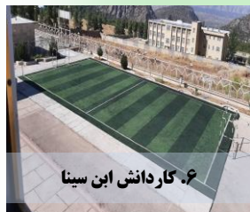
۶. کار دانش ابن سینا