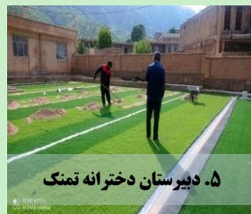
۵. دبیرستان دخترانه تمنگ