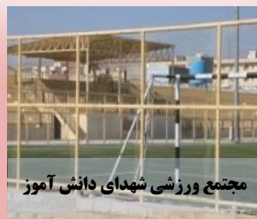
مجمع ورزشی شهدای دانش آموز