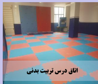
اتاق درس تربیت بدنی