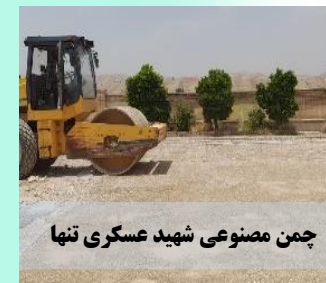
چمن مصنوعی شهید عسکری تنها