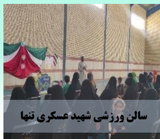
سالن ورزشی شهید عسکری تنها