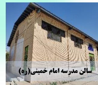
سالن مدرسه امام خمینی (ره)