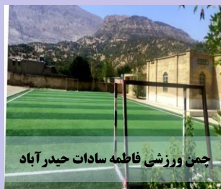
چمن ورزشی فاطمه سادات حیدر آباد