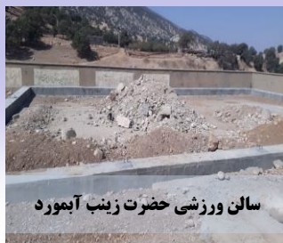
سالن ورزشی حضرت زینب آبهورد