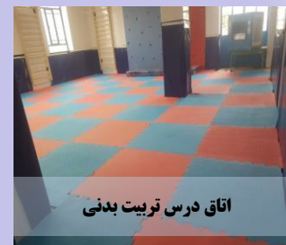
اتاق درس تربیت بدنی