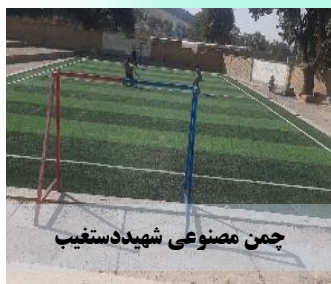
چمن مصنوعی شهید دستغیب