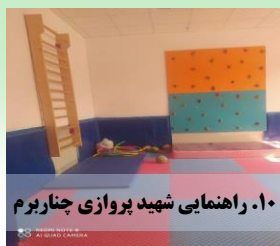
۱۰. راهنمایی شهید پروازی چناربرم