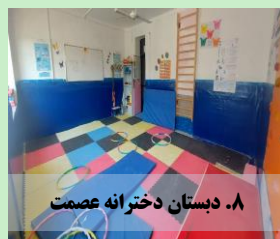
۸. دبستان دخترانه عصمت