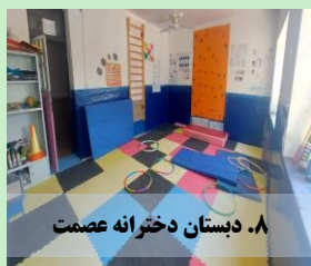
۸. دبستان دخترانه عصمت