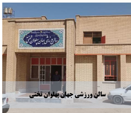
سالن ورزشی جهان پهلوان تختی