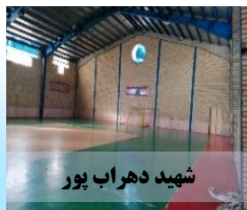
شهید دهراب پور