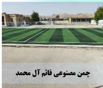
چمن مصنوعی قائم آل محمد