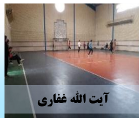
آیت الله غفاری