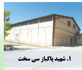
۱. شهید پاکباز سی سخت