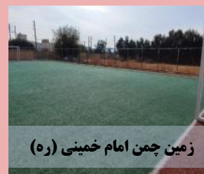
زمین چمن امام خمینی (ره)