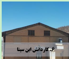
۶. کار دانش ابن سینا