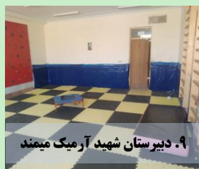
۹. دبیرستان شهید آرمیک میمند