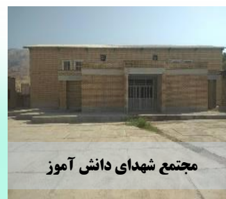
مجتمع شهدای دانش آموز