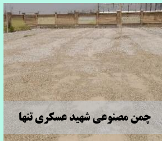
چمن مصنوعی شهید عسکری تنها