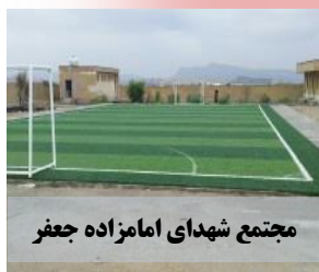
مجمع شهدای امامزاده جعفر