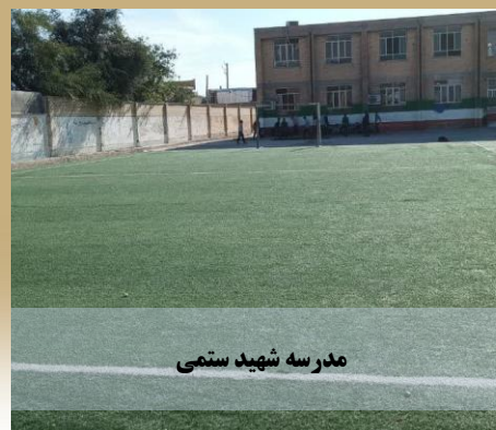
مدرسه شهید ستیمی