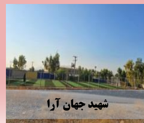
شهید جهان آرا