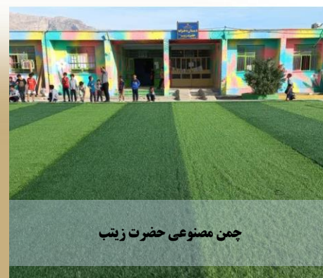
چمن مصنوعی حضرت زینب