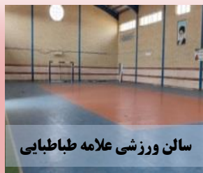
سالن ورزشی علامه طباطبائی