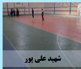
شهید علی پور