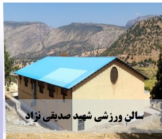
سالن ورزشی شهید صدیقي نژاد