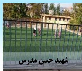
شهید حسن مدرس