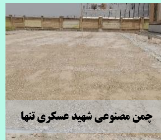
چمن مصنوعی شهید عسکری تنها