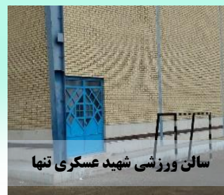
سالن ورزشی شهید عسکری تنها