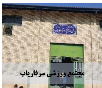
مجتمع ورزشی سرفاریاب