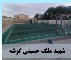
شهید ملک حسینی گوشه