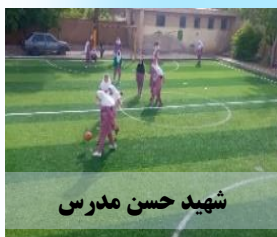
شهید حسن مدرس