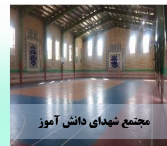
مجتمع شهدای دانش آموز