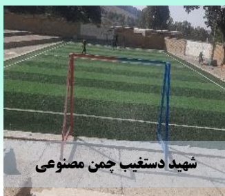
شهید دستغیب چمن مصنوعی