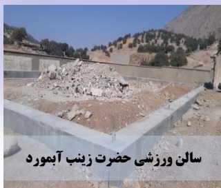
سالن ورزشی حضرت زینب آبهورد