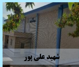
شهید علی پور