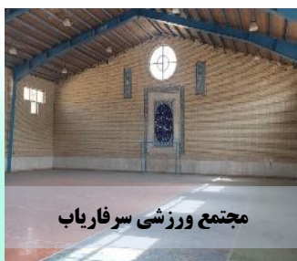
مجتمع ورزشی سرفاریاب