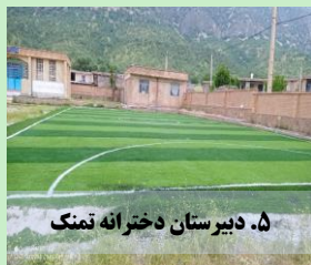
۵. دبیرستان دخترانه تمنگ