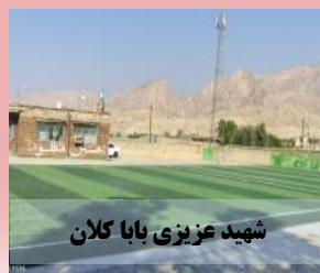
شهید عزیزی بابا کلان