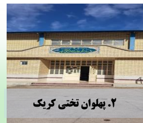
۲. پهلوان تختی کرکک